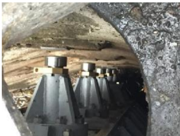
Příklad nastavitelných bočních stoliček

V současné době je MPK odstavena z provozu na základě doporučení technicko - bezpečnostního dozoru a plavba je realizována přes VPK.