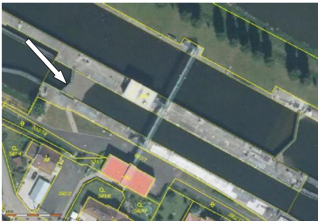
VD České Kopisty dolní vrata MPK - ortofotomapa