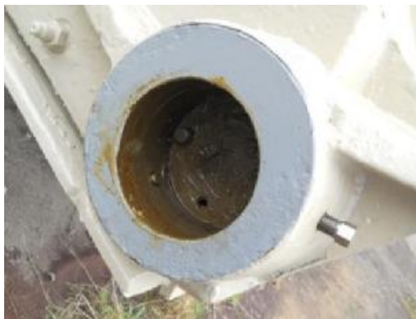
patní ložisko vzpěrných vrat (čep - lůžko)

Současně s opravou patních ložisek bude provedena na každé z obou vrátní i oprava bočních stoliček výměnou stávajících šesti mezilehlých stoliček za nové nastavitelné a opravou dvou krajních stoliček sdružených s ložisky. Je předpokládáno s použitím stoliček nastavitelných pomocí šroubové dvojice s aretací nastavené polohy. Společně se stoličkami budou vyměněny i dosedací "kamery" na armaturách osazených do betonu ve výklencích. Při opravě bude vyměněn všechen demontovaný spojovací materiál za nový dle specifikace prováděcí dokumentace.