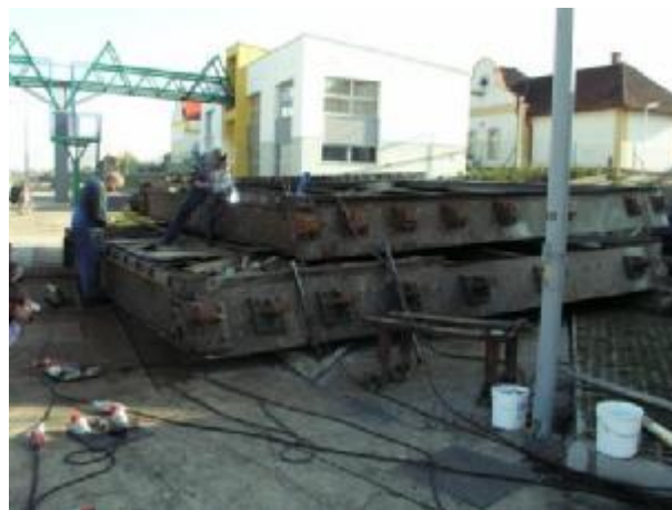
Pracoviště - dolní ohlaví MPK, levý břeh MPK

Přístup k MPK je z levého břehu Labe po veřejné komunikaci obcí České Kopisty a dále po účelových komunikacích a plochách provozovatele VD v areálu plavebních komor České Kopisty. Všechny pozemky, na kterých budou opravné práce prováděny jsou ve správě Povodí Labe, s.p., Víta Nejedlého 951/8, 500 03 Hradec Králové.